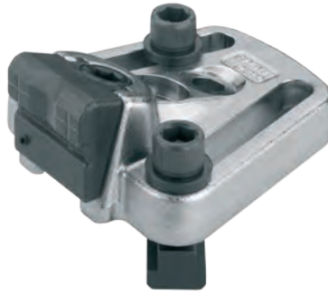
mit Umkehrbacke 008-...-2