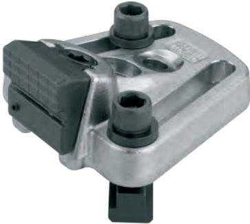
mit Umkehrbacke 008-...-2