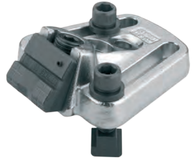
mit Aufsraubbacke für Einsatzbacke 008-...-3